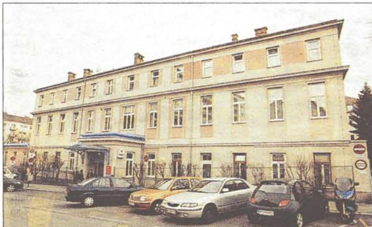
„Unrentabel“: Das Preyer'sche Kinderspital in Favoriten